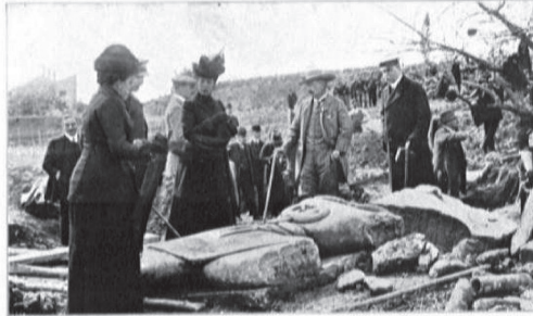
Ihre Majestäten der Deutsche Kaiser Wilhelm II., Königinwitwe Alexandra von Großbritannien und Irland und König Georg I. der Hellenen bei den Ausgrabungen auf Korfu.

beim Kaiser eine Galatafel statt. Zur Tafel, der die Kaiserin wiederum fernblieb, führte der Kaiser die Königin Eleonore von Bulgarien, König Ferdinand die Kronprinzessin, Kronprinz Boris von Bulgarien die Prinzessin Eitel Friedrich, Prinz Kyrill die Prinzessin Viktoria Luise, Prinz Eitel Friedrich die Prinzessin Friedrich Leopold und Prinz August Wilhelm die Prinzessin Viktoria Margarete. Der Kaiser nahm zwischen dem König und