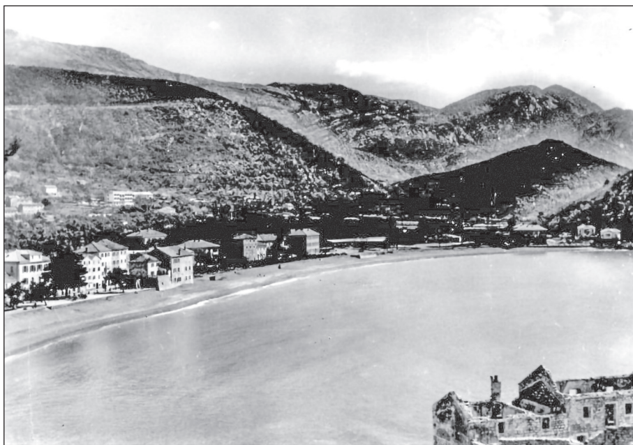
Слика бр. 2: Петровац на Мору средином 20. века. Кућа породице Греговић прва с леве стране.